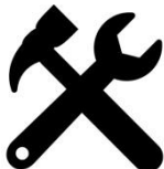
b) Werkzeug und Geräte